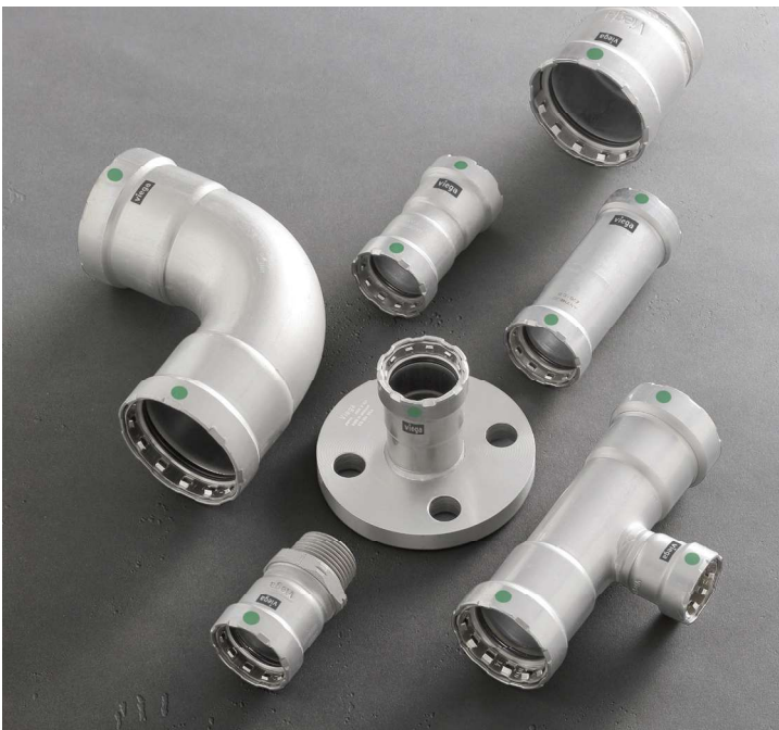
Viega MegaPress de acero inoxidable

Viega MegaPress está certificado por UL y FM para aplicaciones de protección contra incendios en tamaños de ½" a 2". Al igual que con otros sistemas de prensado de Viega, los accesorios Viega MegaPress se pueden utilizar en ensamblajes prefabricados, consiguiendo una instalación recta y limpia. Y con la tecnología patentada Smart Connect, los plomeros pueden comprobar que todos los accesorios en ensamblajes prefabricados estén bien prensados.