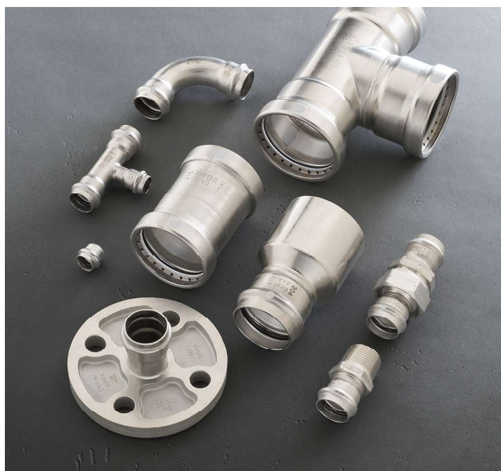
Viega ProPress en acero inoxidable 304

Para obtener una lista completa de aplicaciones, consulte la tabla de la página 15.