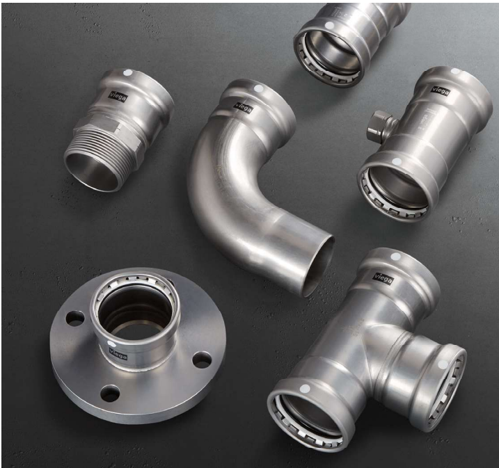
Viega MegaPress XL