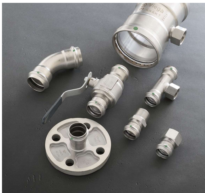
Viega ProPress en acero inoxidable 316